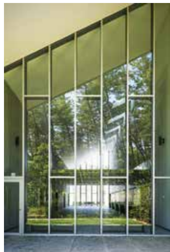
設計: SHAA 設計共同 体