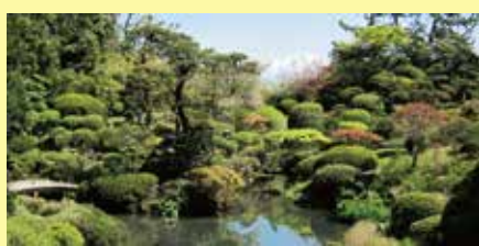
↑本間氏別邸庭園 鶴舞園 (かくぶえん) ←清遠閣 (せいえんかく)