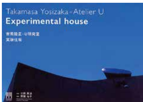
『実験住居』吉阪隆正+U 研究室 MM シリーズ vol3 共著