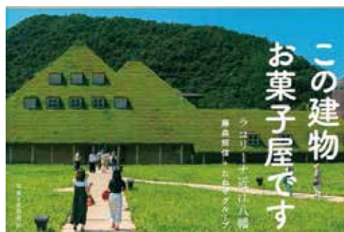
『ラ コリーナ近江八幡』 藤森照信+たねやグループ・共著