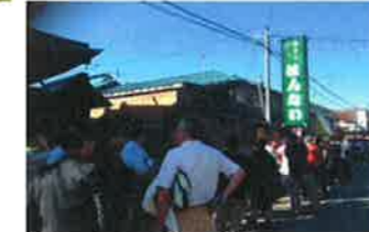
喜多方ラーメン「ばんない」長蛇の列