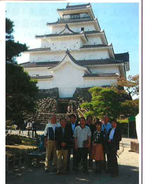
帰路は鶴ヶ城を見学して来ました。