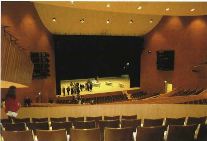
客席からみた舞台