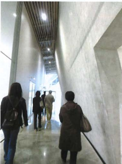
通路床(コンクリート磨き仕上げ)