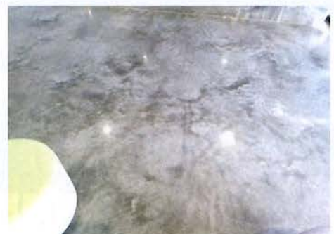
ここ何処、どこにもパターン化が見られない広大な宇宙を思わせるような、床の空間。見ているだけで引き込まれる。