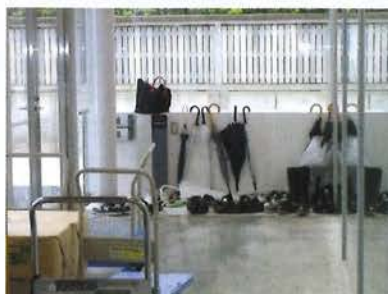
職員出入口(使い方が残念)