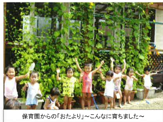
保育園からの「おたより」~こんなに育ちました~

「緑のカーテンプロジェクト」の1年目は学童保育(小学生)、2年目は老人ホームでしたが、今年、市内保育園の年長さんを対象にしてみました。例年、ふうせんかずらのみでしたが、あさがお・ゴーヤ・へちま・ひょうたんと種類を増やし、ゴールデンウィーク中に種を植えて、苗を育てました。