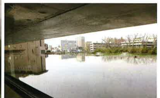
2F ラウンジ(カフェコーナー) 千秋公園を望む水庭 お堀との一体感がある空間

これらの視点は年々重要度が増してきて継続していくべき活動であると確認しました。今、私たち建築士に求められていることは何かを考え、私たちの成すべきことを実行していくために横の繋がり、縦の繋がりを大切にコミュニケーションをしっかりと取っていきましょう！と7月全建女奈良大会での再会を約束し閉会しました。