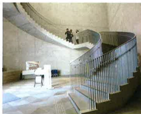
秋田県立美術館 エントランスホールのらせん階段