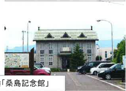
「旧小池医院」「桑島記念館」