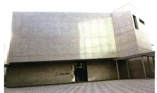
秋田県立美術館 (H25移転再OPEN 設計:安藤忠雄)

さて、会議では今年度の活動について東北ブロック会女性委員会の共通テーマについても話し合われました。これまでは、「エコロジー」「省エネ」「再生可能エネルギー」「リサイクル」といったテーマが引き継がれ、震災をうけて「復興へ」また「防災」といった活動も身近なものになってきています。